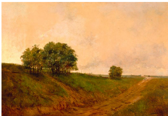
Antonio Parreiras, Manhã de inverno , 1894 – Acervo da Pinacoteca do Estado de São Paulo

Antonio Parreiras, pinturas e desenhos , Pinacoteca Luz, de 06 de outubro de 2012 a 3 de março de 2013. A mostra apresentou 20 trabalhos realizados entre 1887 e 1929. Antonio Parreiras (Niterói, RJ, 1860-1937) é considerado um dos principais paisagistas brasileiros entre o final do século dezenove e as primeiras décadas do século vinte. As obras que integraram a exposição pertencem ao acervo da Pinacoteca e do Museu Antonio Parreiras, RJ, primeiro museu dedicado à obra de um único artista e que este ano completa 70 anos.