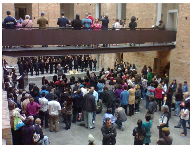
Contadora de Histórias, 4 Batutas e Coral Infantil e Juvenil da OSESP

A Pinacoteca Luz, que concentrou a maior parte das atividades, recebeu 7.100 visitantes.