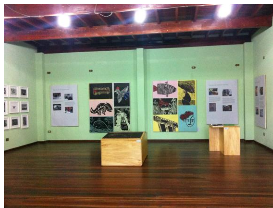
Montagem e vista geral da exposição De um lado a outro – ação educativa extramuros da Pinacoteca de São Paulo , no centro Cultural Roberto Gomes Colaço, em Iguape